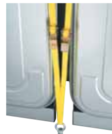
Hochwasserschutz in Verbindung mit dem Verankerungssystem für DWT 750 und 1000 Liter