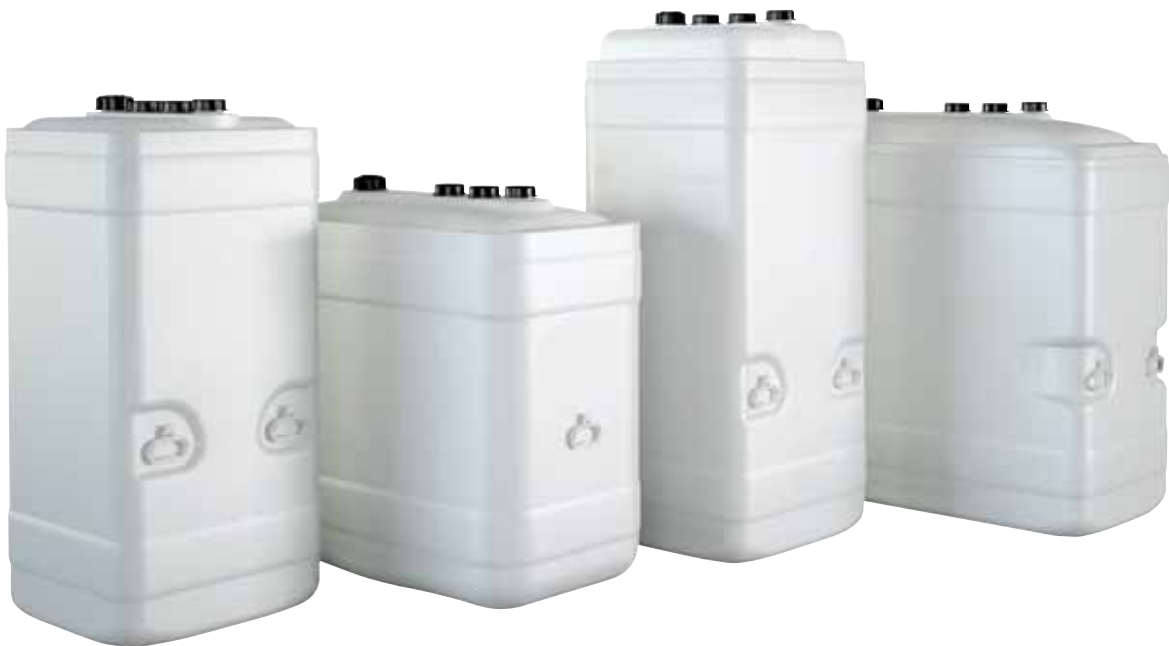
Kunststoffwannen-Tanks KWT (750 I-C, 1000 I-R, 1000 I-C, 1500 I-R) – kompakte Abmessungen, geringes Gewicht