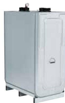
Vitoset Doppelwandtank DWT