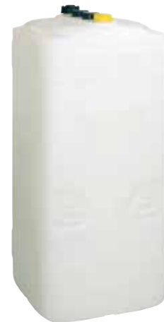
Vitaset Kunststoffwannen-Tank KWT