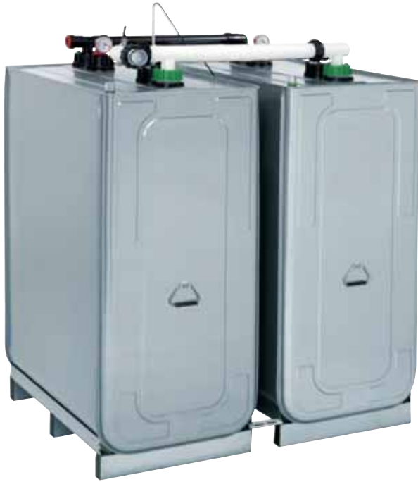
Doppelwandtanks DWT mit 750, 1000 und 1500 Litern Inhalt – feuerfest, lichtundurchlässig, diffusionsdicht, hochwassersicher