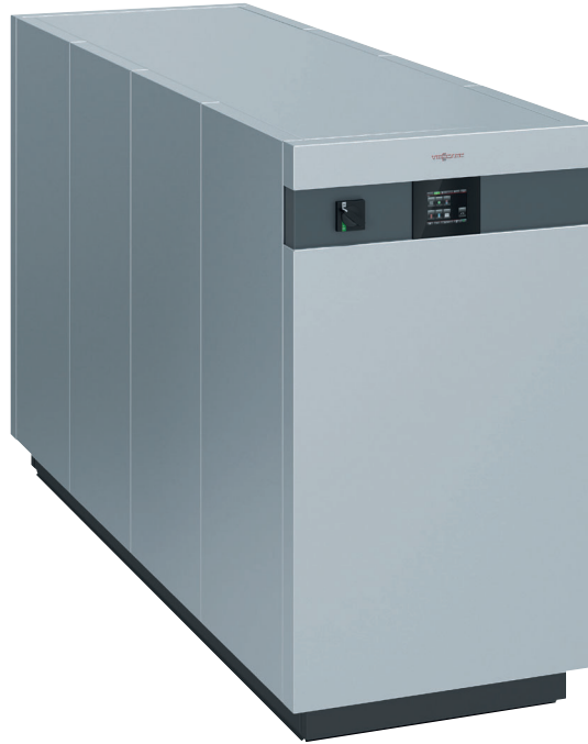
Vitocal 350-HT Pro Nenn-Wärmeleistung Sole/Wasser: 56,6 bis 144,9 kW (B0/W35) Nenn-Wärmeleistung Wasser/Wasser: 133,3 bis 351,5 kW (W45/W90)

Regenerative Wärme für gewerbliche Einsätze wird durch den Bedarf an hohen Vorlauftemperaturen bestimmt.