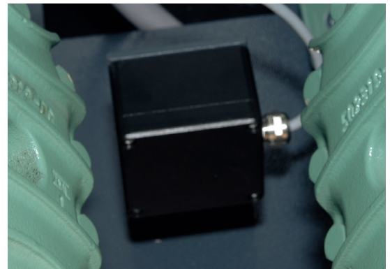
Automatische Dichtigkeitsüberwachung Gasdetektor

Mit dem neuen HFO-Kältemittel R1234ze erfüllt die Baureihe bereits heute Kältemittelanforderungen, die weit über 2020 hinaus gelten. Das GWP (Global Warming Potential) ist im einstelligen Bereich und damit natürlichen Kältemitteln fast gleichzusetzen.