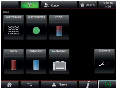
Einfach zu bedienende SPS-Regelung mit Farb-Touch-Display